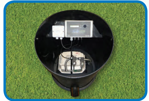
TORNADO Premium pro Außensteuersäule

Alle BLUEVITA Anlagen entsprechen den CE – Konformitätsanforderungen.