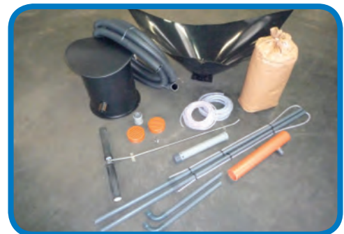
TORNADO Premium pro Rüstsatz