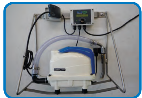
TORNADO Premium eco Wandkonsole